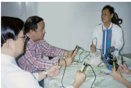
In Manila wurde die PowerTube klinisch getestet.

Bei allen Versuchspersonen zeigte sich dasselbe deutliche Muster: Eineinhalb Stunden nach der Behandlung stieg die Konzentration von Chlorphenolen in Blut und Urin rasant an, um dann nach 24 Stunden auf eine signifikant tiefere Konzentration als vor der PowerTube -Anwendung abzufallen. Dies bestätigt, was Martin Frischknecht über die Wirkung seiner PQQ-Technologie sagt: Sogar im Gewebe eingelagerte (und damit im Blut oder Urin nicht unbedingt nachweisbare) Giftstoffe werden durch die drei Frequenzen gleichsam „aufgewirbelt“ – deshalb die nach 90 Minuten gemessene deutlich erhöhte Chlorphenolkonzentration. Jetzt kann der Körper die Umweltgifte über die Harnblase ausscheiden, weshalb man viel Wasser trinken sollte. So erklärt sich die viel tiefere Chlorphenolkonzentration, die man in Blut und Urin einen Tag nach der Behandlung fand. Die gemessene Entgiftungsleistung der PowerTube lag sogar noch weit über den Erwartungen ihres Erfinders. Es zeigte sich nämlich, daß nur schon eine einzige Behandlung von 21 Minuten die ursprünglich gemessenen Giftwerte um bis zu 70 Prozent senken konnte! Hinter diesen trockenen Zahlen verbirgt sich eine wissenschaftliche Sensation. Entsprechend deutlich fiel denn auch das Fazit des Professors aus: „Die PowerTube aktiviert eindeutig den Metabolisierungsprozeß und führt zu einer Entgiftung aller Probanden. Würde man die PowerTube regelmäßig anwenden, dann ist die Wahrscheinlichkeit hoch, daß