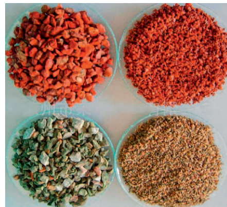
Zeolith-Proben unterschiedlicher Herkunft.

Nimmt man nun dieses spezielle Pulver ein, so hat man einerseits die positive Wirkung des Siliziums für den Körper, und zusätzlich werden alle „falsch-schwingenden“ Zellen im Körper umgestimmt und wieder zurück in die Harmonie gebracht. Diese zusätzliche „Energetisierung“ des Körpers ist ein enormer Pluspunkt – man stärkt seinen Körper und den Befindlichkeitszustand also in zweifacher Weise oder salopp gesagt: Zwei Fliegen auf einen Streich!