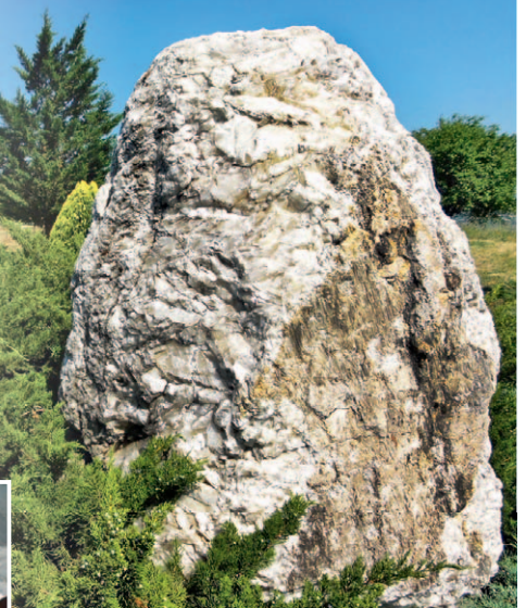
Die Hunza (links) trinken zeolithhaltiges Gletscherwasser – eine der Quellen ihrer Langlebigkeit. Oben ein großer Zeolithblock.