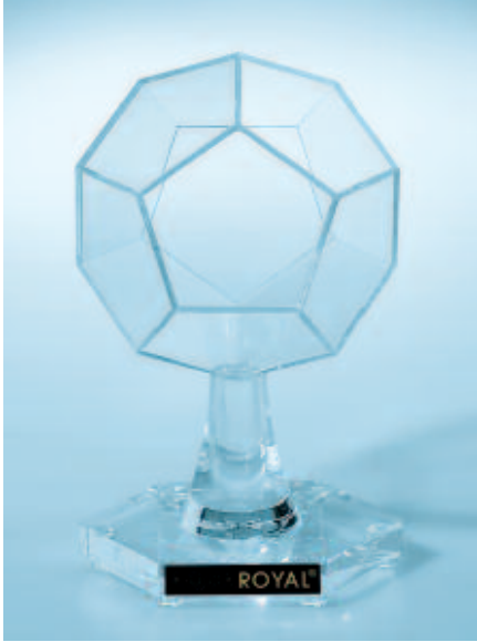
Der große Bruder: Energiestern Plus.

geringere Neigung zu Aggressionen und Depressionen.