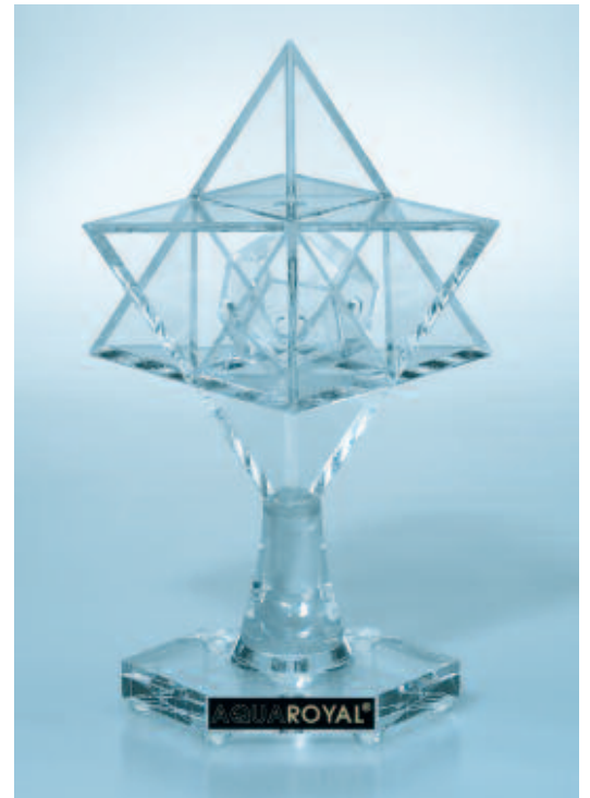
Der edle Raumstern schützt das ganze Haus.

Als Werkstoff entschied sich Vogel für das energieneutrale Acrylglas, das sich sehr gut eignet, um mit natürlichen Schwingungsinformationen aufgeladen zu werden. Der kleine Ener-