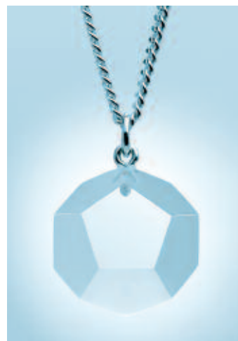
Energiestern in Acryl zum Tragen.

Von Kunden genannt werden: Mehr Energie, größere Wachheit, mehr Konzentration, besserer Durchblick, mehr Selbstsicherheit (z. B. gegenüber dem Vorgesetzten), ein Gefühl des Schutzes, mehr Toleranz, Gelassenheit, Heiterkeit, mehr Bereitschaft zu verzeihen und sich auszusöhnen und eine