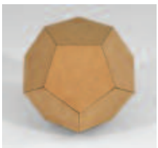
Im Dodekaeder finden sich alle platonischen Körper und über 720 Goldene Schnitte.