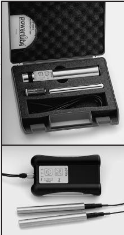
Die vergoldete Power Tube (oben) wird wie der Power QuickZap (unten) in einem robusten Kofferchen geliefert.

von wenigen Tagen eine spürbare Besserung zu verzeichnen.“